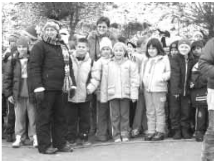
předstartovní horečka mladších účastníků