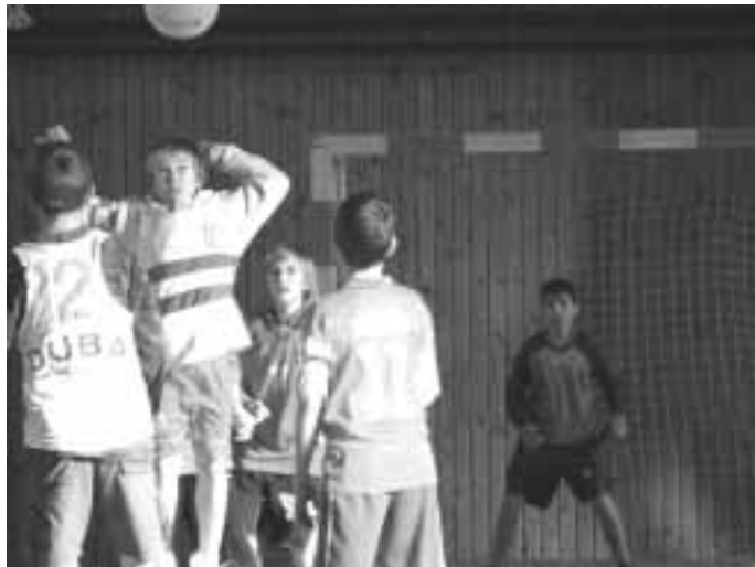
nezbytný fotbalový turnaj na závěr