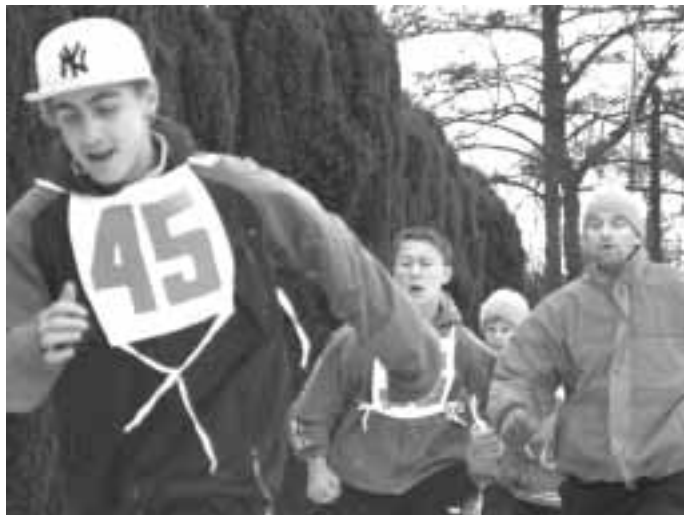
... a na špičce