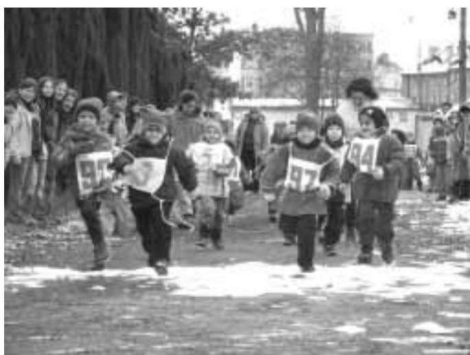
... a je odstartováno!