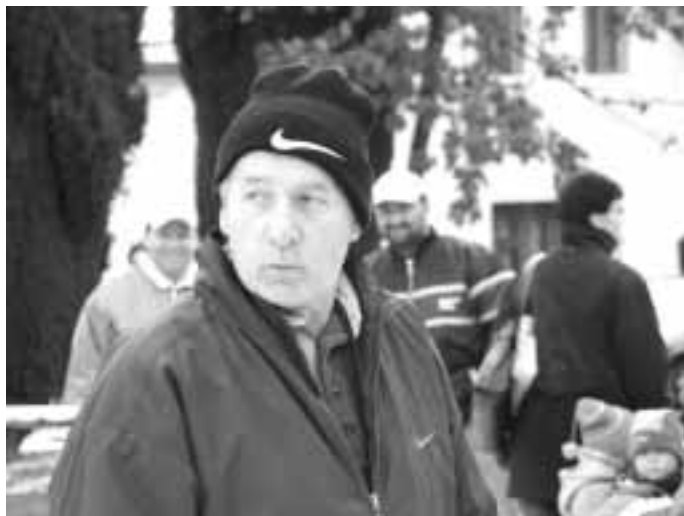
Máme všechno pod kontrolou?