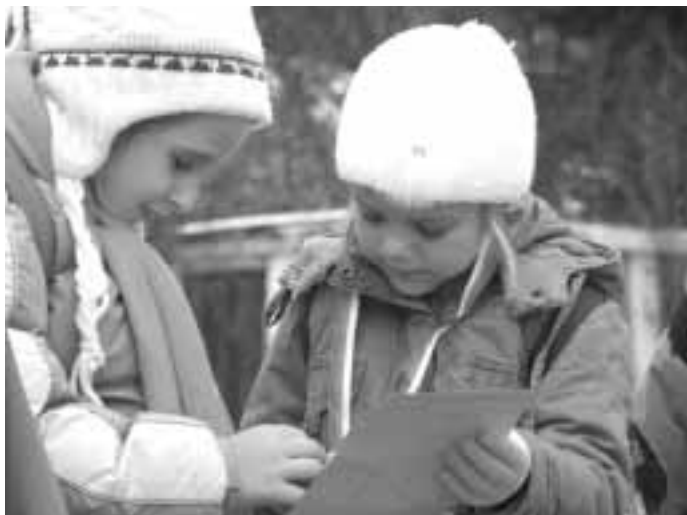
A jaká si byla?