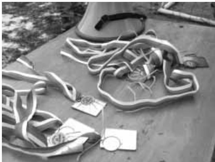
Stolek pro vítěze ...