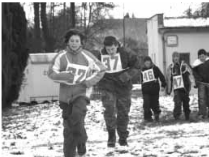
na chvostě ...