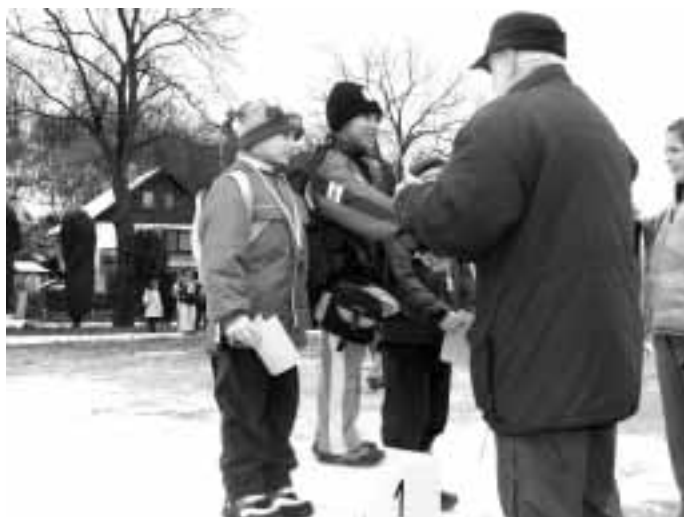
na stupních vítězů ti nejlepší