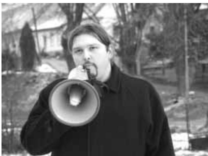
trocha nostalgie ....