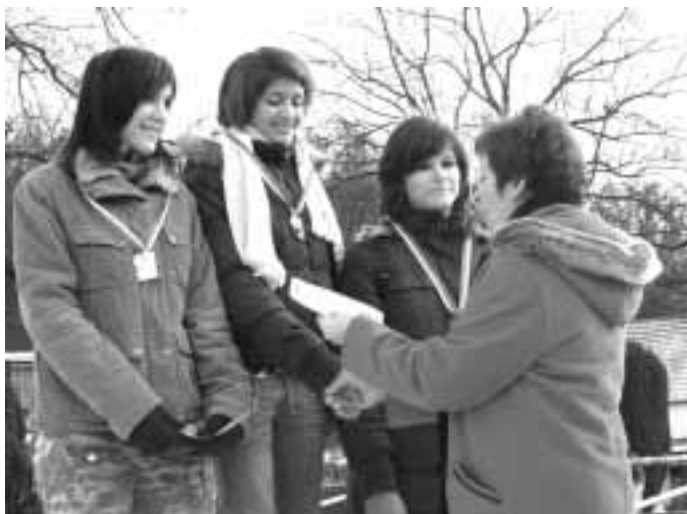
pocit na stupních vítězů