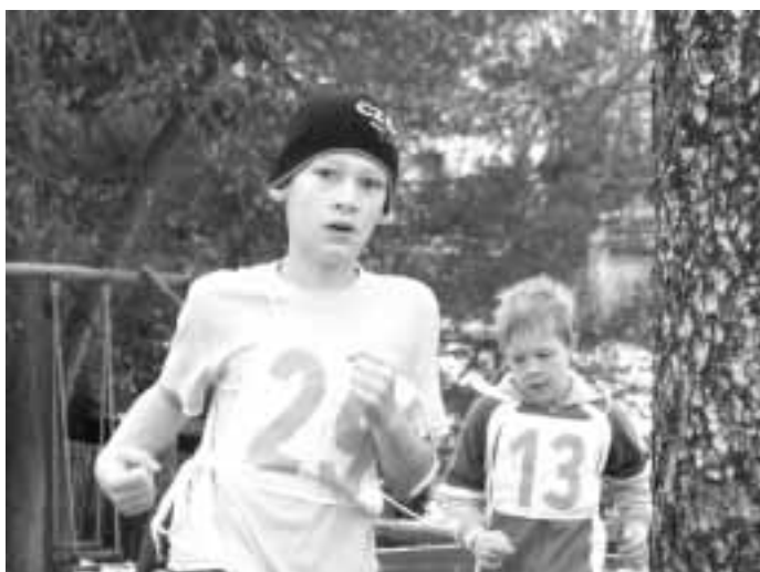
bitva na otočce